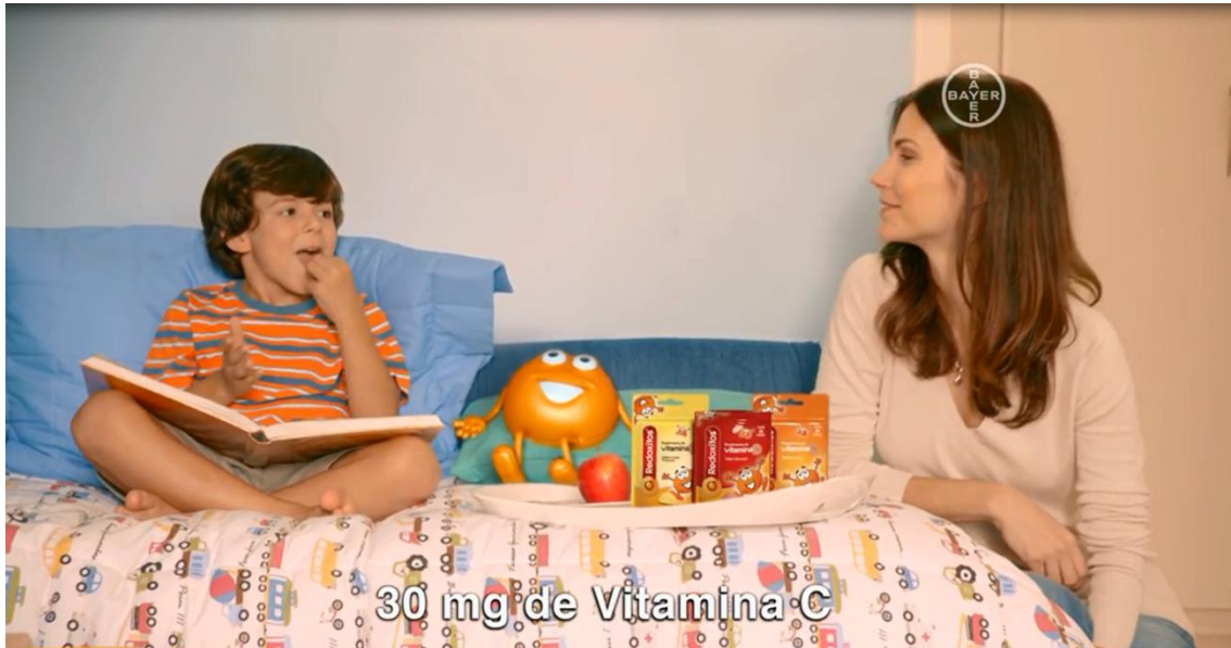
Imagem do comercial exibido na TV

“REDOXITOS, A VITAMINA C EM FORMA DE GOMINHA, AGORA VEM TAMBÉM NOS SABORES MORANGO E FRUTAS TROPICAIS”