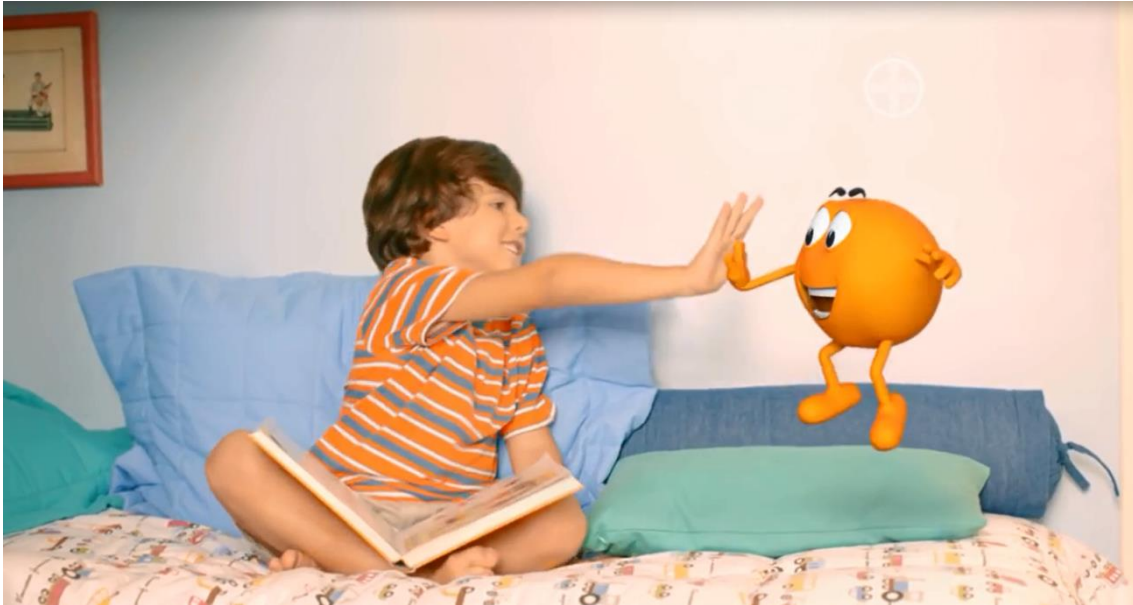
Imagem do comercial exibido na TV