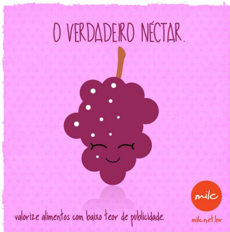
Imagem retirada da página do Facebook do MILC 20