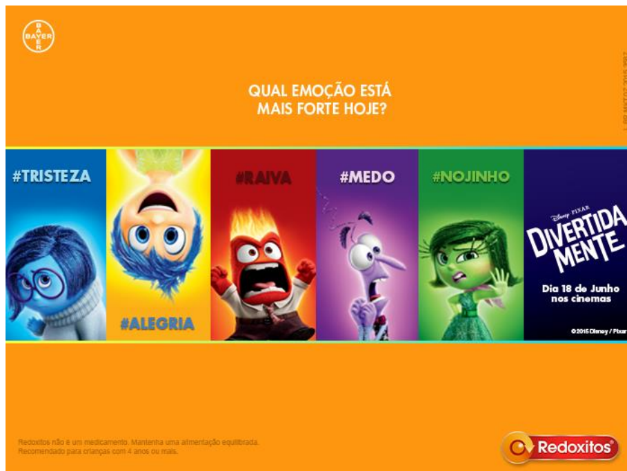
Imagem da página do Facebook da marca

A ação da marca é desenvolvida, também, na página da rede social do Facebook da Redoxitos 7 . Na página, são exibidos ambos os comerciais divulgados na TV, além de imagens com as personagens do filme “Divertidamente”.