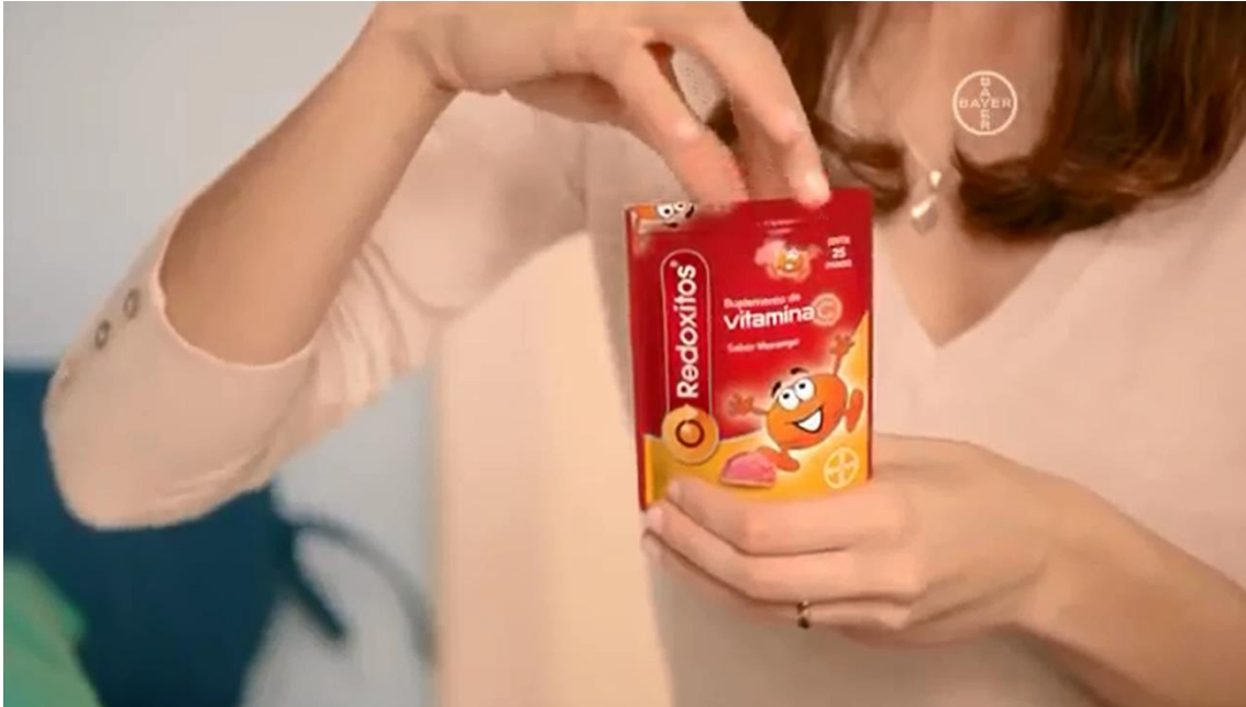
Imagem do comercial exibido na TV

“CHEGOU REDOXITOS, CADA GOMINHA CONTÉM A DOSE ADEQUADA DE VITAMINA C PARA SEU FILHO TODOS OS DIAS.”