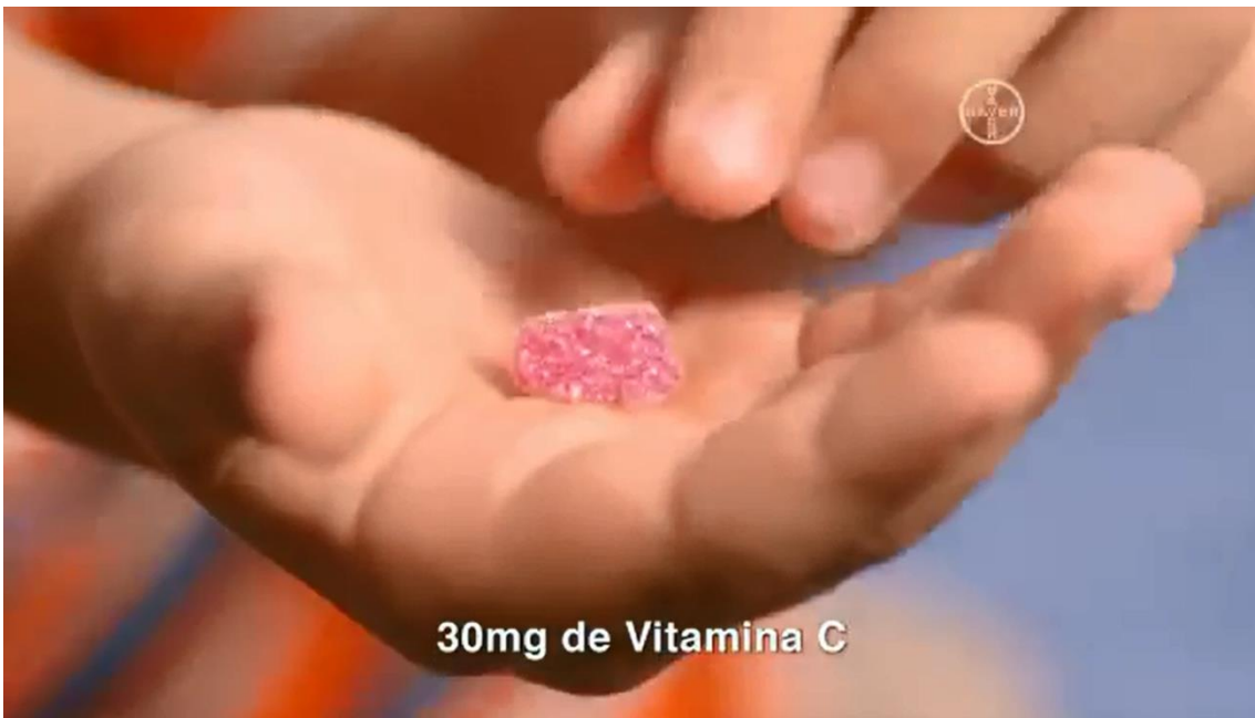
Imagem do comercial exibido na TV