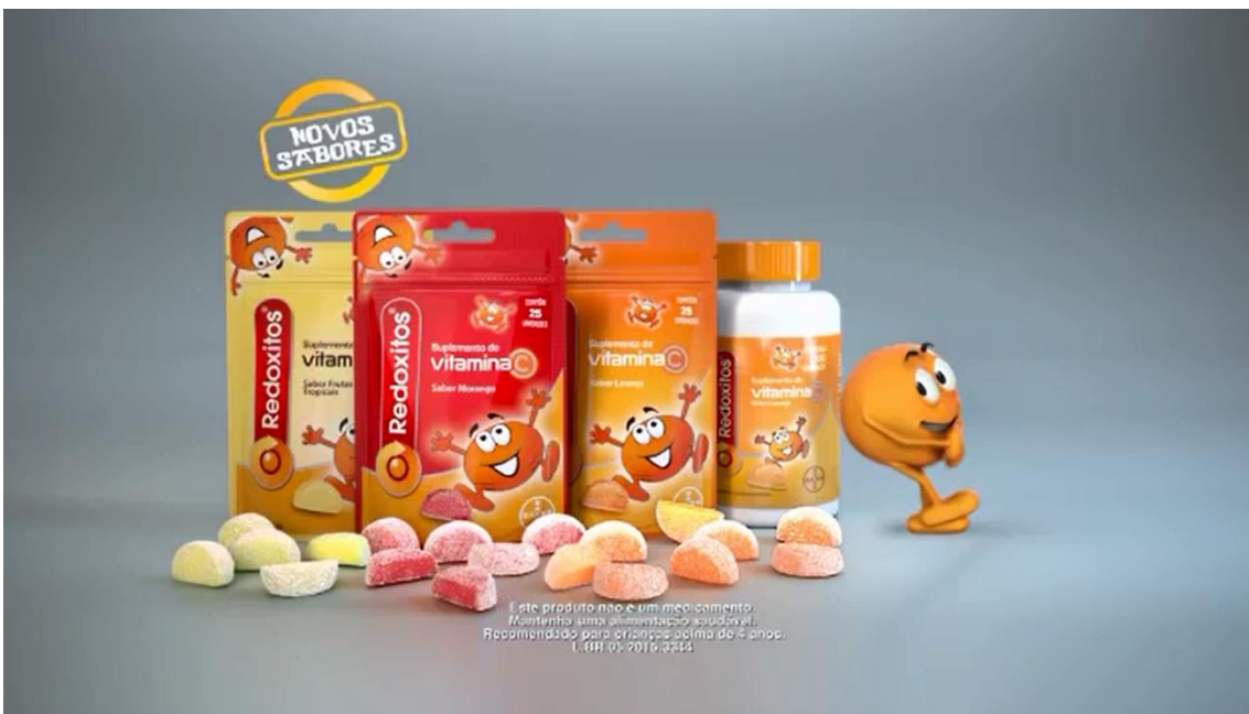
Imagem do comercial exibido na TV

“REDOXITOS. DIVERSÃO QUE AJUDA A PROTEGER O SEU FILHO”.