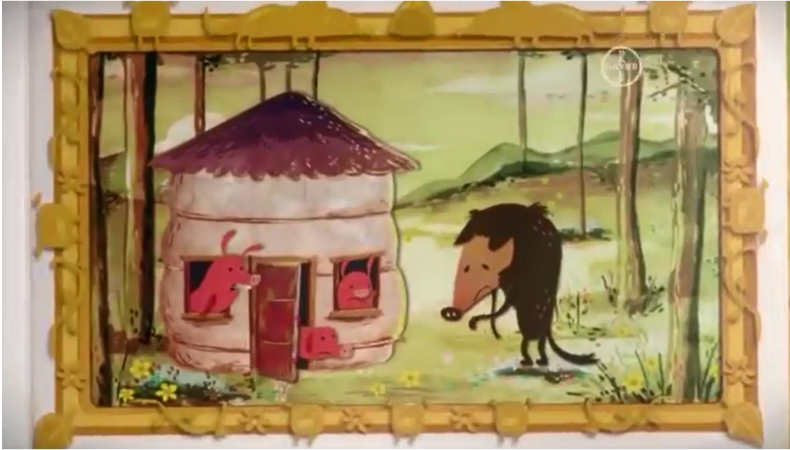
Imagem do comercial exibido na TV

“ELE TENTOU, TENTOU, SEGURAR, MAS DERRUBOU A CASINHA QUE OS TRÊS PORQUINHOS TINHAM ACABADO DE CONSTRUIR”