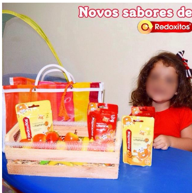
Imagem retirada do Instagram 9

Outra estratégia desenvolvida pela empresa, foi o envio de kits com o produto, juntamente com itens infantis, para diversas mães blogueiras. Com base nas fotos disponibilizadas na rede social Instagram, os kits acompanhavam uma carta escrita a mão, e convites para eventos e ações da Redoxitos em que as mães pudessem levar seus filhos: