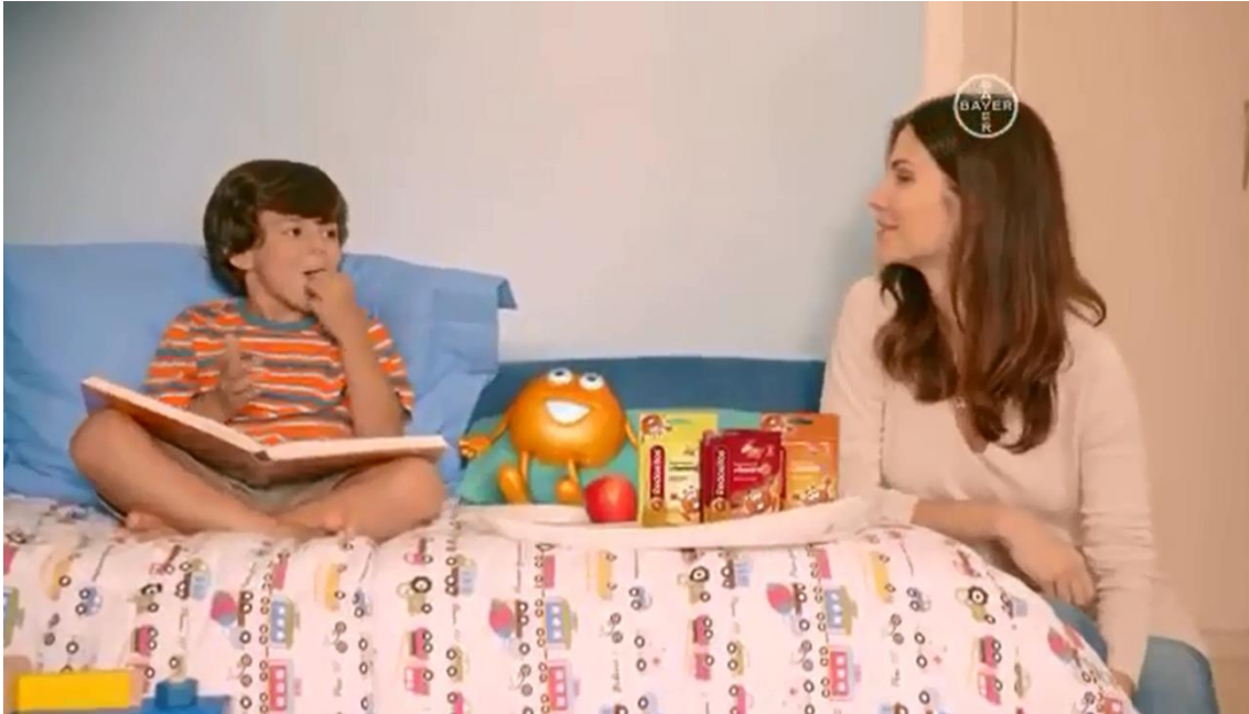
Imagem do comercial exibido na TV