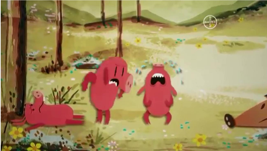
Imagem do comercial exibido na TV