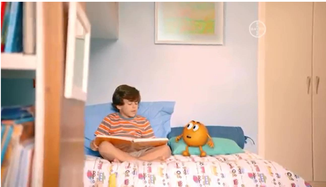
Imagem do comercial exibido na TV

O menino, que lê o conto ao lado da personagem laranja da marca Redoxitos, inicia a história: