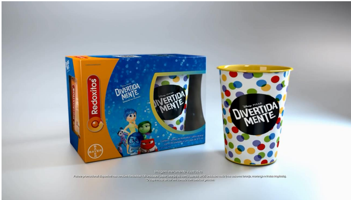
Imagem do comercial exibido na TV