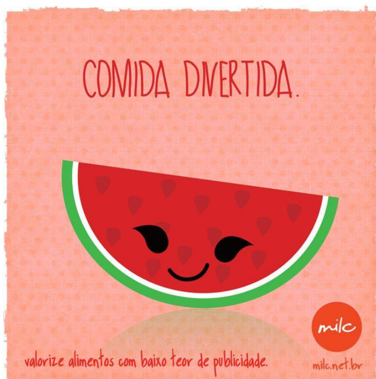
Imagem retirada da página do Facebook do MILC 21