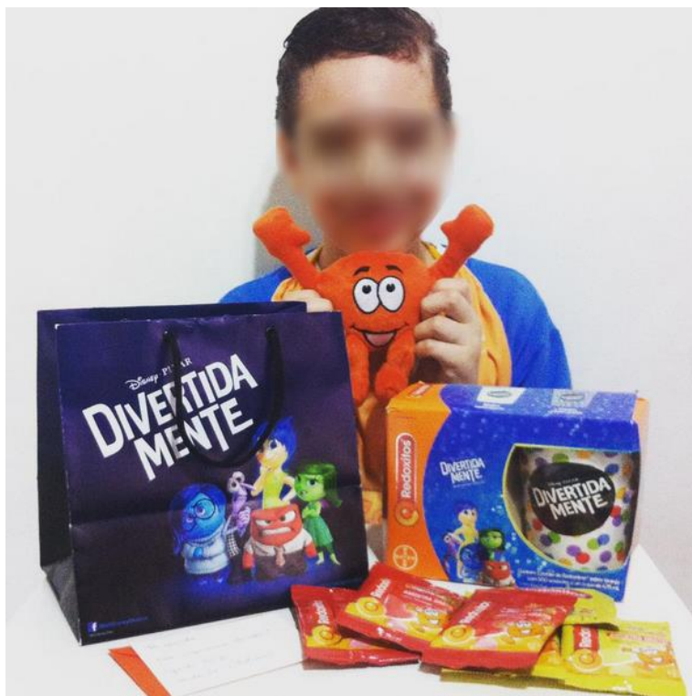
Imagem retirada do Instagram 15

Algumas mães bloggeiras se posicionaram contra essa forma de assédio nas redes sociais, e, inclusive, criaram a campanha “Remédio não é bala”, valorizando a ingestão de alimentos in natura , ricos em vitamina C, em detrimento do consumo de suplementos vitamínicos que buscam atingir o público infantil.