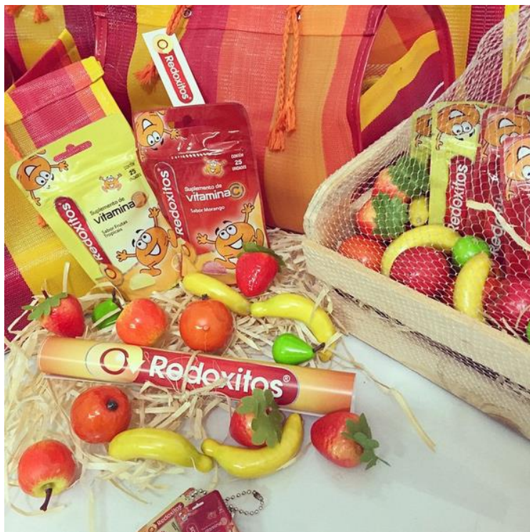
Imagem retirada do Instagram 14

REDOXITOS VEM EM UMA EMBALAGEM PROMOCIONAL COM 100 UNIDADES DE VITAMINA C E UM COPO EXCLUSIVO DO FILME QUE MUDA DE COR.”