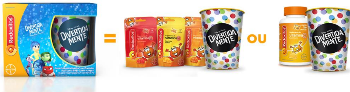
Imagem do site 4 da marca

A promoção elaborada consiste na venda de embalagens promocionais de Redoxitos (uma versão com 3 pacotes com 25 unidades, ou um pote com 100 unidades) as quais acompanham um copo do filme que muda de cor, e que é decorado com as personagens do filme da Disney lançado recentemente e conhecido pelo público infantil, “Divertidamente”.