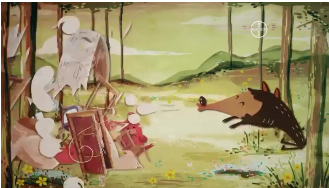
Imagem do comercial exibido na TV

Então, é mostrado o lobo derrubando a casa dos três porquinhos por meio de um espirro, de maneira a mostrar que estava gripado.