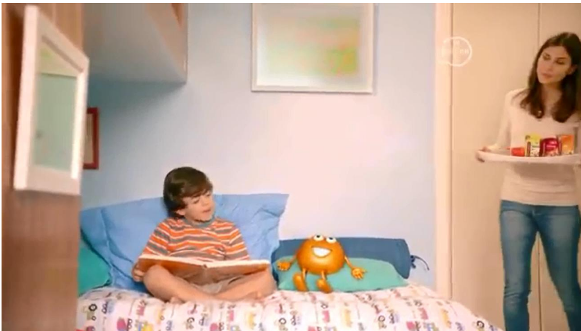
Imagem do comercial exibido na TV

Então, a mãe do narrador entra no quarto com uma bandeja com alimentos e uma embalagem de Redoxitos, e a personagem da marca respira aliviado.