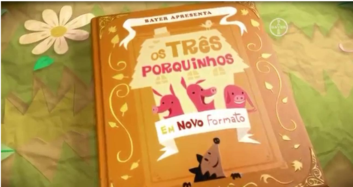
Imagem do comercial exibido na TV

O menino, que lê o conto ao lado da personagem laranja da marca Redoxitos, inicia a história: