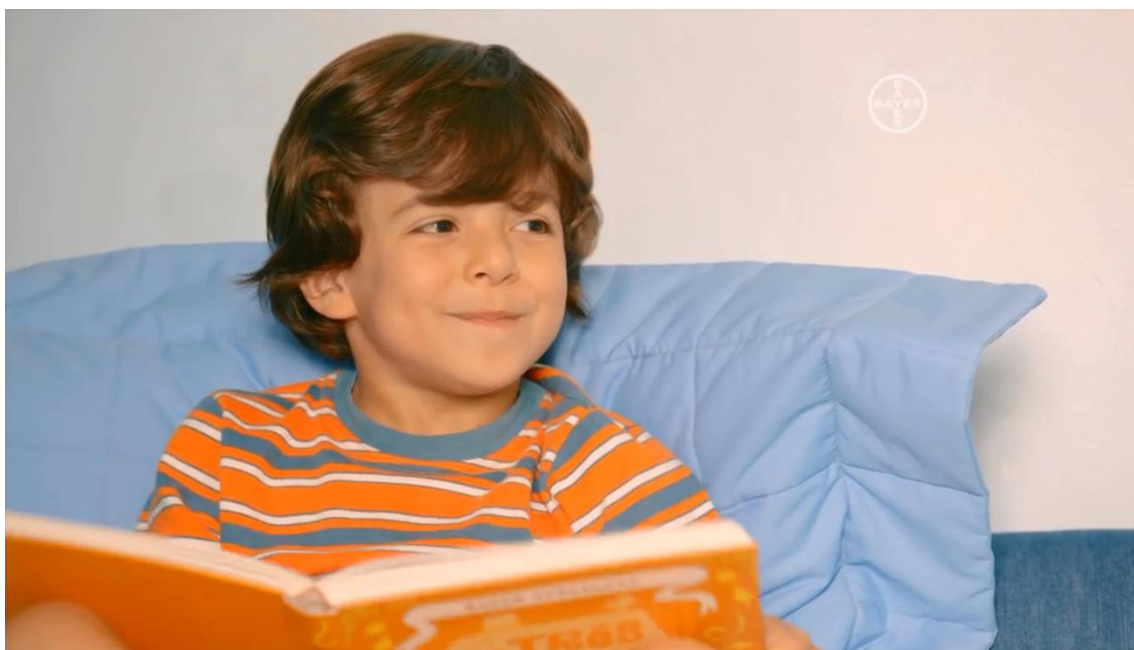
Imagem do comercial exibido na TV