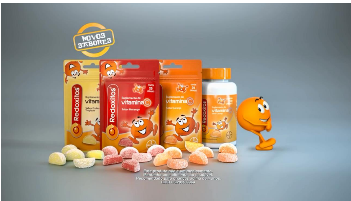
Imagem do comercial exibido na TV

Por fim, a narradora apresenta a promoção do copo do filme “Divertidamente”: