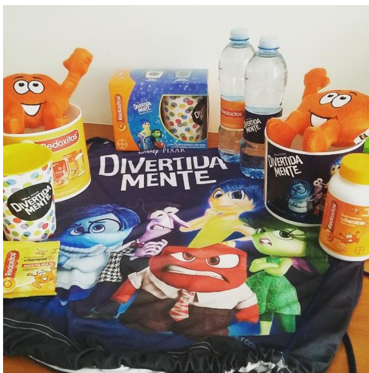
Imagem retirada do Instagram 13