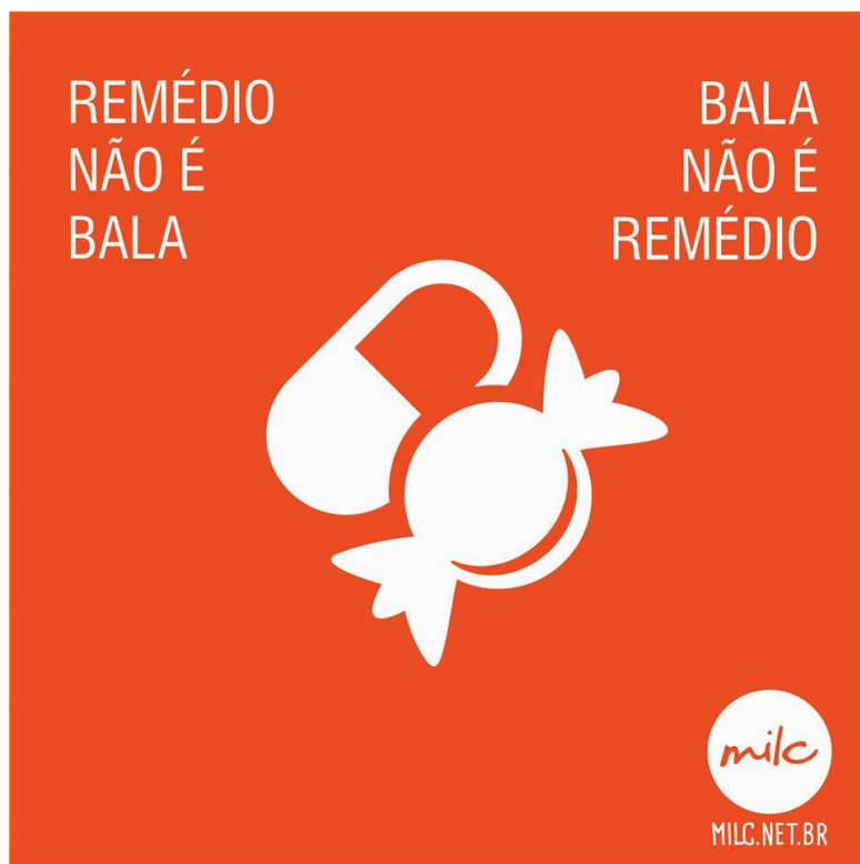
Imagem retirada da página do Facebook do MILC 17