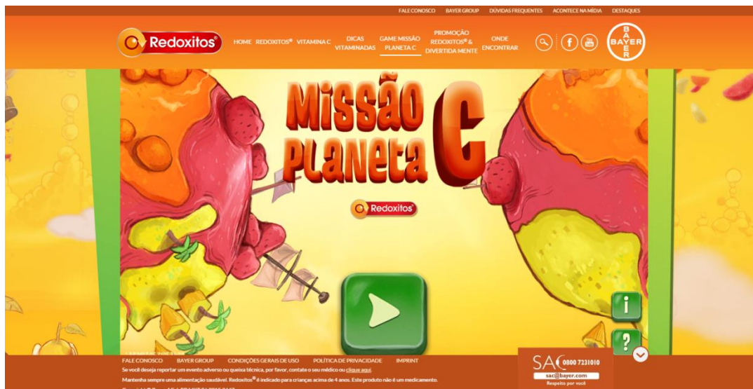
Imagem do game no site da marca

Uma das fases tem como título “O incrível reino do suco de laranja”.