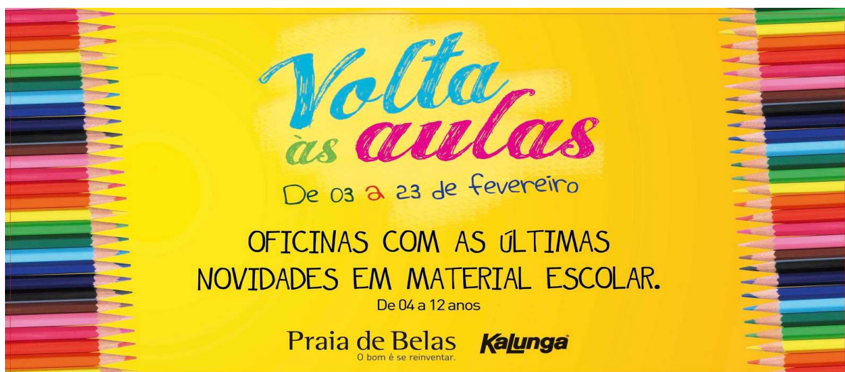
Imagem de divulgação do evento 3

em parceria com a papelaria Kalunga e com o apoio das marcas Chamequinho, Licyn, Pritt e BIC.